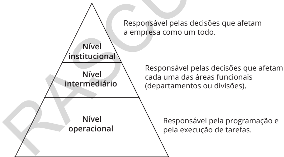
FIGURA 1.1: Níveis organizacionais

A Figura 1.1, a seguir, ilustra esses três níveis organizacionais: