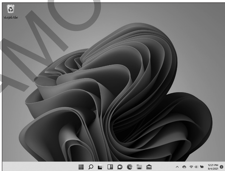
FIGURA 1-2: O Windows abandonou o modo Tablet encontrado no Windows 10.

A Microsoft exhibe o Windows 11 como uma solução de computação universal que roda em notebooks e PCs desktop (anteriormente na Figura 1-1), assim como nas telas de toque, inclusive tablets, como mostrado na Figura 1-2.