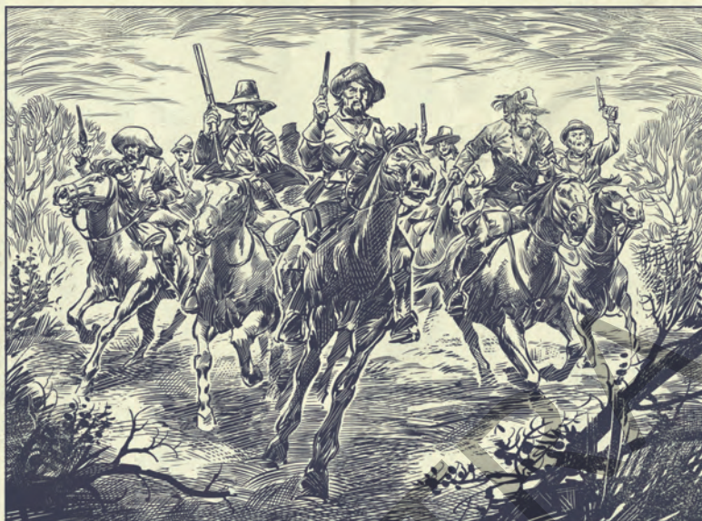
Combatentes irregulares semeiam o caos ao longo do rio Mississippi.

Em ambos os lados, a irritação da batalha e o espírito de vingança, agravados pelo peso do recrutamento, das requisições e dos confiscos, parecem ter atingido o paroxismo. Ninguém pode prever o resultado dessa luta fratricida.